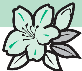
Símbolo da Cidade Flor: Azálea (Tsutsujji)